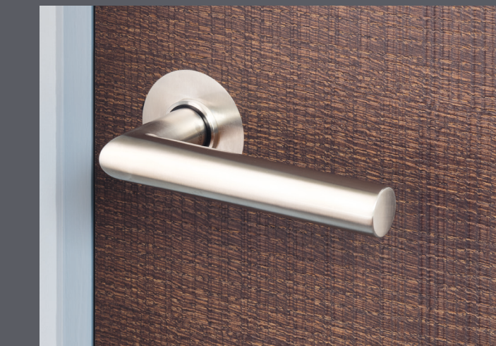
Drücker 1273B Edelstahl

flächenbündig nur in Kombination mit bündig einschlagend möglich