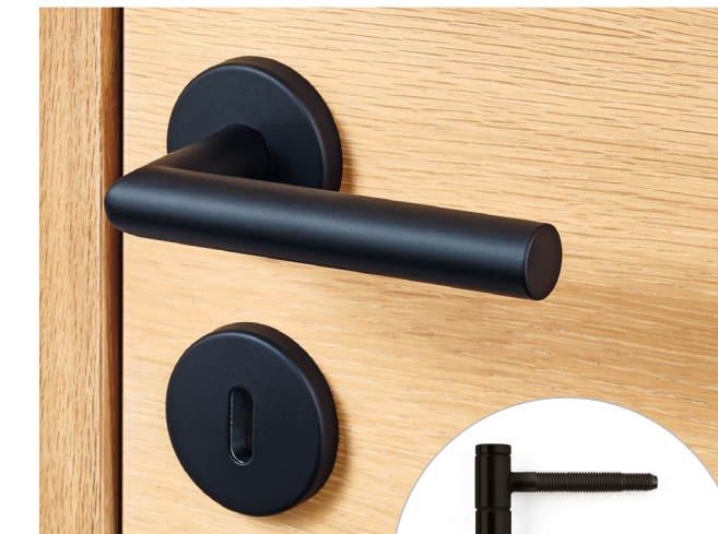
Drücker 1001 Schwarz matt

Mit unseren hochwertigen Drückern setzt du optisch Akzente und hast deine Türen immer bestens im Griff.