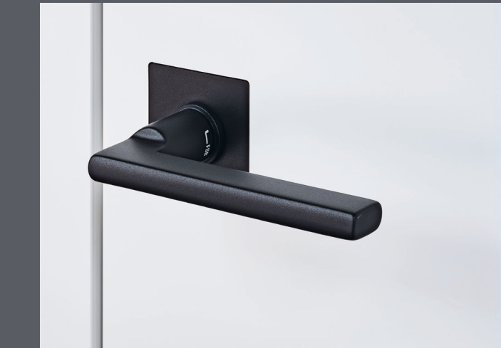
Drücker 1035BQ Schwarz matt

flächenbündig nur in Kombination mit bündig einschlagend möglich