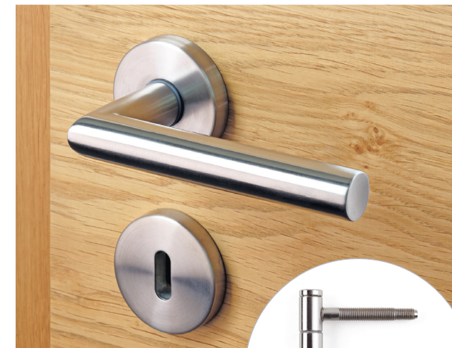
Drücker 1001 Edelstahl